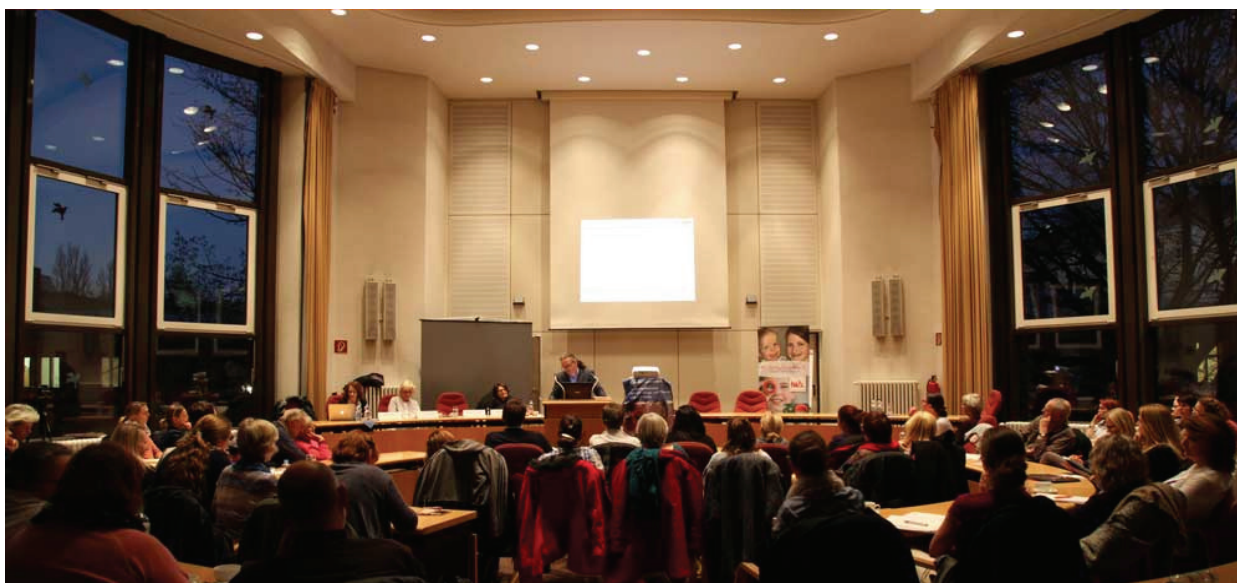
Akademieveranstaltung in Kooperation mit der AOK Nordost zum Thema Inklusion, am 19.11.2018 im Rathaus Moabit, Berlin

Neben der Hilfestellung für betroffene Eltern selbst liegt ein weiterer Schwerpunkt der Akademie auf der Unterstützung von Mitarbeitern von Selbsthilfeorganisationen bei der Bewältigung ihrer Aufgaben. 2018 war hier von den Anforderungen an Selbsthilfeorganisationen durch die Umsetzung der EU-Datenschutzgrundverordnung geprägt. Hierzu wurden 5 Seminare angeboten. Zwei weitere Seminare wurden zum Thema "Betriebswirtschaftliche Grundlagen und Förderprinzipien" abgehalten. Neben diesen inhaltlich sehr praxisnahen Themen wurde aber auch das Problem der Überforderung von Engagierten in der Selbsthilfe aufgegriffen und ein Seminar zu Entlastungsstrategien angeboten.