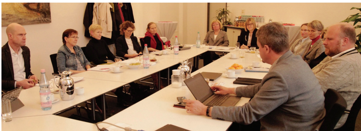
Förderkreissitzung in der Berliner Koordinierungsstelle am 29.10.2018

Da dem Förderkreis bis auf wenige Einzelförderer nur Unternehmen und Unternehmensverbände aus dem Pharmabereich angehören, werden stets Themen aus dem Kompetenzbereich dieser Unternehmen gewählt. 2018 wurde die patientenorientierte Durchführung von Kinderregistern thematisiert, 2019 soll es um kindgerechte medizintechnische Devices zur Applikation von Medikamenten gehen. Wichtig ist allen Beteiligten die Schaffung von Transparenz über die Arbeit dieses Gremiums; wir binden deshalb immer Mitgliedsorganisationen ein und veröffentlichen die Protokolle auf unserer Website.